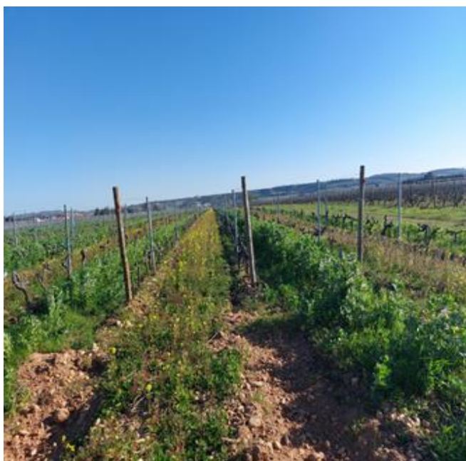
Exemple de Couvert encore hétérogènes en Crozes Hermitage, le 1 er Avril 2025

Après un mois de septembre et octobre très pluvieux, le mois de novembre et le mois de décembre plutôt sec et peu ensoleillé n'ont pas été favorable au couvert semé tardivement.